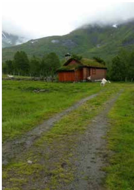
Layout/trykk: Ions Kantor AS, Foto: Christer Lundberg Nes, May Britt Haukås og Bjørg Jacobsen.